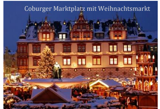
Coburger Marktplatz mit Weihnachtsmarkt

Diese Advent-Reise führt mitten in das Herz Deutschlands, in die Genussregion Bayerns, nach Oberfranken. Die Residenzstadt Coburg liegt zwischen Thüringer Wald und Maintal. Die „Veste“ Coburg, wegen ihrer Schönheit und ihrer beherrschenden Lage auch die Fränkische Krone genannt, erhebt sich mit ihren gewaltigen Mauern und Türmen hoch über der Stadt.