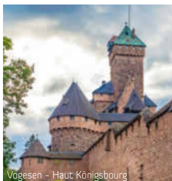
Vogesen - Haut Königsbourg

Fahrt nach Colmar und Besichtigung: Altstadt mit „Altem Kaufhaus“, Pfisterhaus, Dom St. Martin, Haus der Köpfe, Klein-Venedig, Dominikanerkirche, Madonna im Rosenhag, Museum Unterlinden mit dem Isenheimer Altar, u.a.m. Nach der Mittagspause Besuch des vielleicht schönsten Weinstädtchens im Elsass, Eguisheim. Am Abend Fahrt in die Weinberge zur „Auberge du Bollenberg“. Abendessen in einem typischen Restaurant.