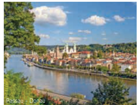
Passau - Donau

Während Sie schliefen, hat die MS Modigliani in Nürnberg festgemacht. Am Morgen erwartet Sie der Reisebus und bringt Sie ins Stadtzentrum, wo Sie von einem ortskundigen Führer erwartet werden, der Ihnen bei einer Altstadtführung die zahlreichen Sehenswürdigkeiten zeigt. Das Schiff ist bereits nach Erlangen gefahren und der Reisebus bringt Sie nach der Besichtigung zur Anlege-