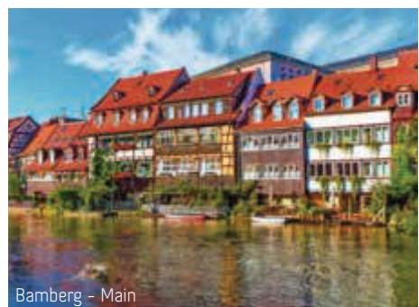
Bamberg - Main

Nach dem Frühstück macht die MS Modigliani in Straßburg fest und es heißt Abschied nehmen. Am Vormittag Möglichkeit zu einem Stadtbummel in Straßburg. Nach der Mittagspause Rückfahrt nach Mönchenglöblichbach.