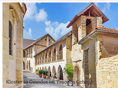
Kloster in Omodos im Troodos Gebirge